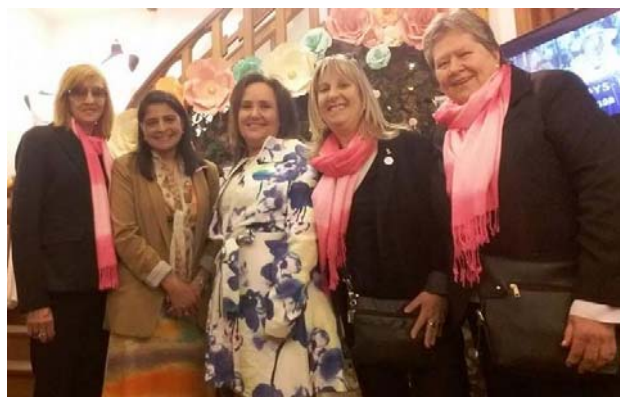
Dame Tu Mano en el Atelier de Gladys T y la Embajadora de Costa Rica